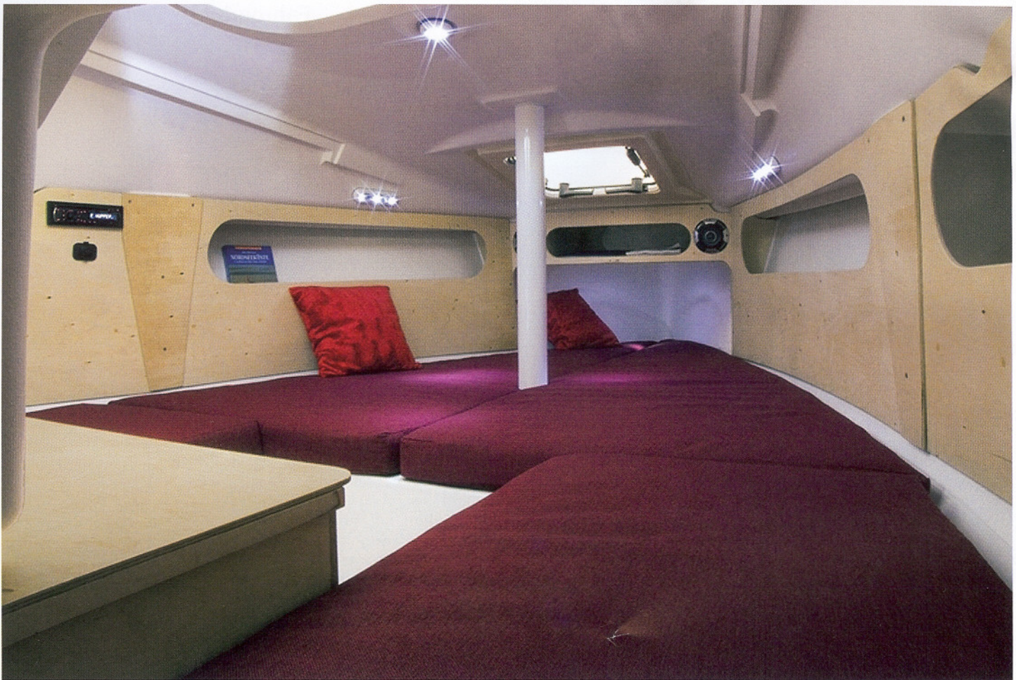
Für die VA 18 gibt es Ausbaupakete, um das sportliche Boot komfortabel auszustatten.