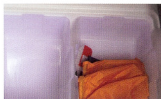
Viel praktischer Stauraum.