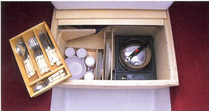
Praktische Kocherschublade unter dem Niedergang.