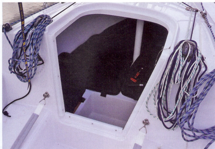
Blick in die Standard-Kabine.