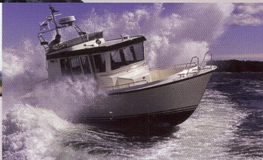
Manöver mit kleiner Crew: Praktische Seemannschaft für Motor- und Segelboote