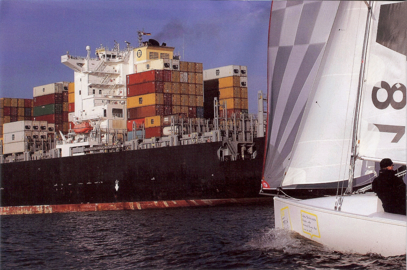
Die VA 18 segelt agil und liegt perfekt am Ruder.

sportlich-aggressives ausstrahlte. Die VA 18 kommt dagegen rein weiß daher. Absolut nichts, woran sich das Auge zunächst erfreuen oder festhalten könnte. Auffällig allenfalls der kleine Bugspriet (Option).