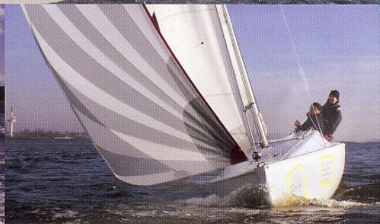
Varianta 18: Dehler's Rotkäppchen kommt als segelnder Preisschlager daher