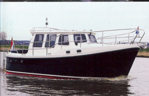
Cantia 28 Cabin Cruiser: Neuaufgabe eines niederländischen Kutters