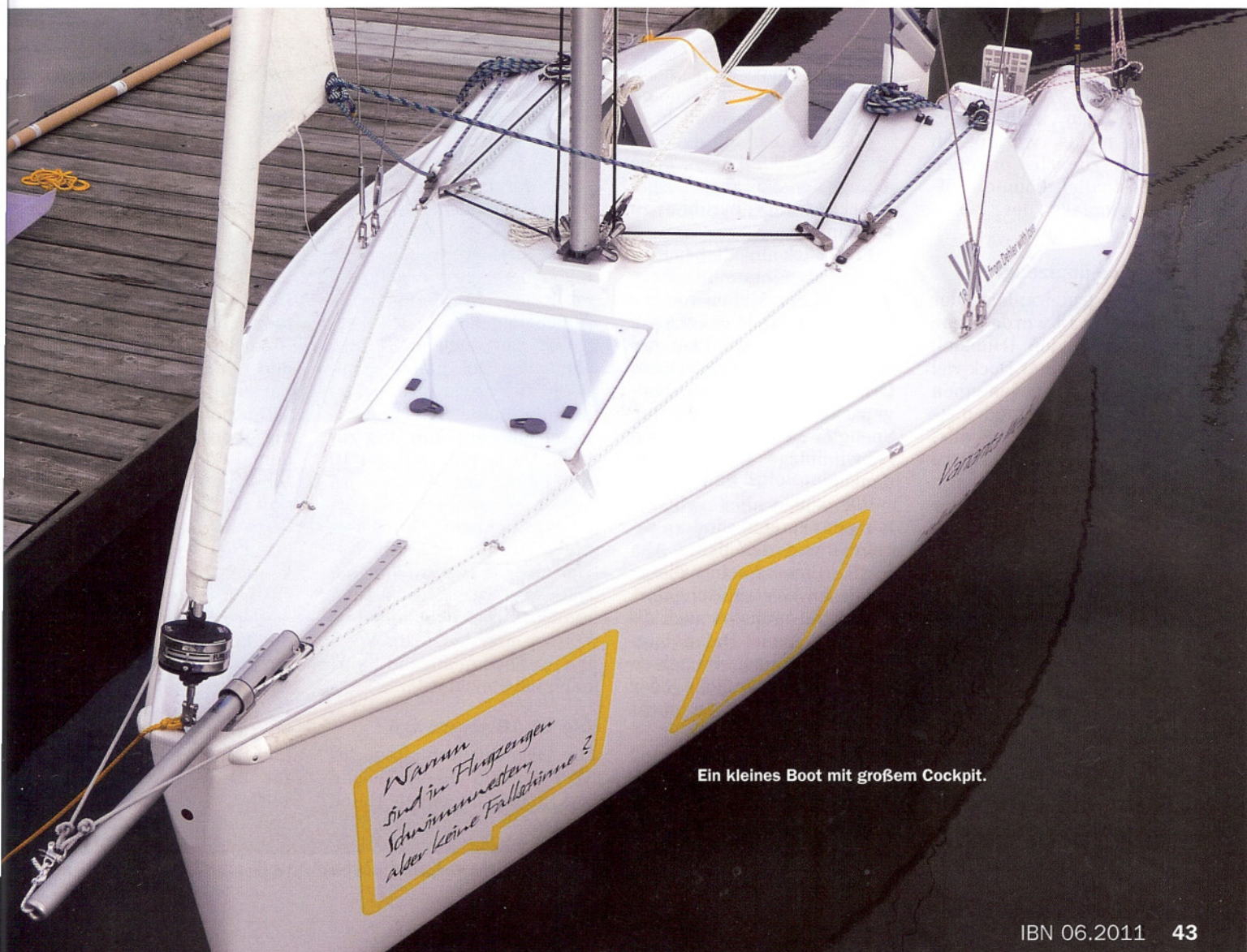
Ein kleines Boot mit großem Cockpit.

Wie schon erwähnt, herrschte bei uns allerdings Skepsis, ob sich der lediglich 5,50 Meter lange und 2,40 Meter breite Kleinkreuzer durchsetzen würde. Zumal schon rein optisch das alte „Rotkäppchen“ mit seinem roten Dach dem wohnlicheren Ambiente und der Doppelruderanlage erst einmal mehr zu bieten schien und für die damalige Zeit etwas